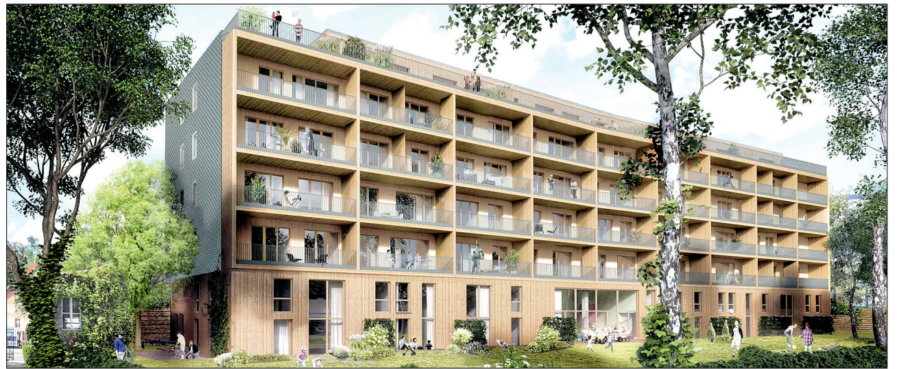
In Berlin wurde kürzlich die Grundsteinlegung für das größte Holzgebäude der Stadt – „Walden 48“ genannt – gefeiert. Das Gebäude umfasst 40 Wohneinheiten auf sechs Geschossen und unterstreicht die Bedeutung der Hauptstadt als Standort innovativer städtischer Holzarchitektur.