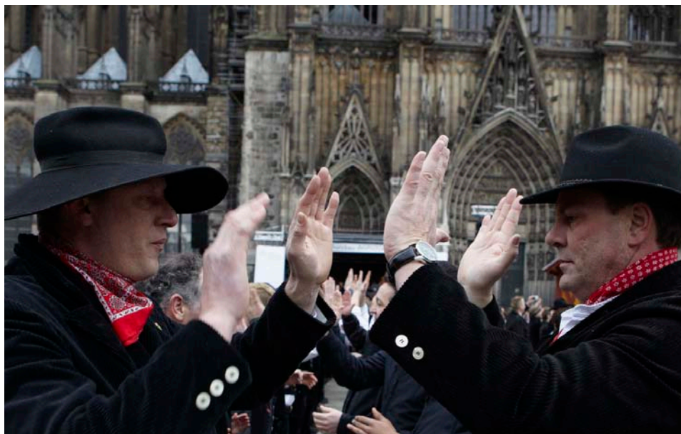
Der Kölner Dom bot eine hervorragende Kulisse für den großen Zimmererklatsch.